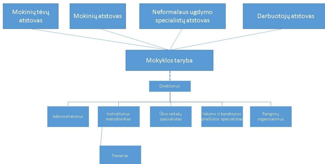
1 pav. Mokyklos organizacinė schema

Mokyklai vadovauja direktorius, kurio veiklą reglamentuoja mokyklos nuostatai ir pareigybės aprašymas.